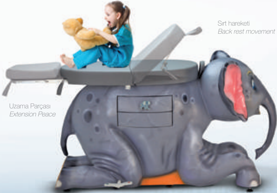
Sirt hareketi Back rest movement